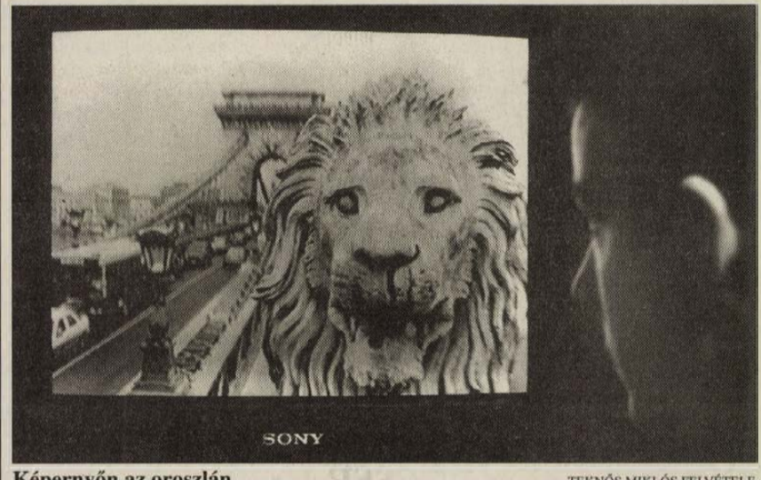
Képernyőn az oroszlán